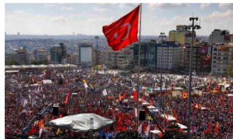
反政府デモに集まった人たちであふれるトルコ・イスタンブール中心部の広場

デモ隊と治安部隊がぶつかって、死者やけが人も出ています。オリンピックをどこで開くかは9月に決まります。選考に影響があるのではないかと、という声もあります。