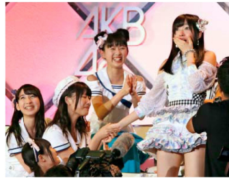
AKB48の「選抜総選挙」で1位になった指原莉乃さん(右端) || 横浜海港北区の日産スタジアム ||

総選挙は2009年に始まり、今年で5回目。今回はAKBやHKTのほか、名古屋のSKE48、大阪のNMB48、中国・上海のSNH48、グループを卒業した元メンバーら計246人が立候補しました。